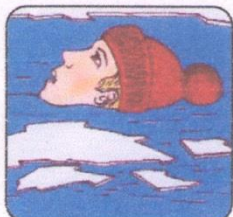
Не погружаться в воду с головой