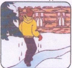
Не отдыхая, бежать к ближайшему жилью

Собираясь выйти на лед водоёма помните о мерах безопасности и правилах поведения на льду!