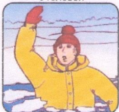
Не паниковать, позвать на помощь