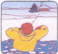
Выбираться в сторону, с которой произошло падение