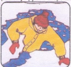
Забросить на лёд ногу, откатиться от полыньи