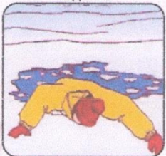
Наползая на лёд, раскинув руки в стороны